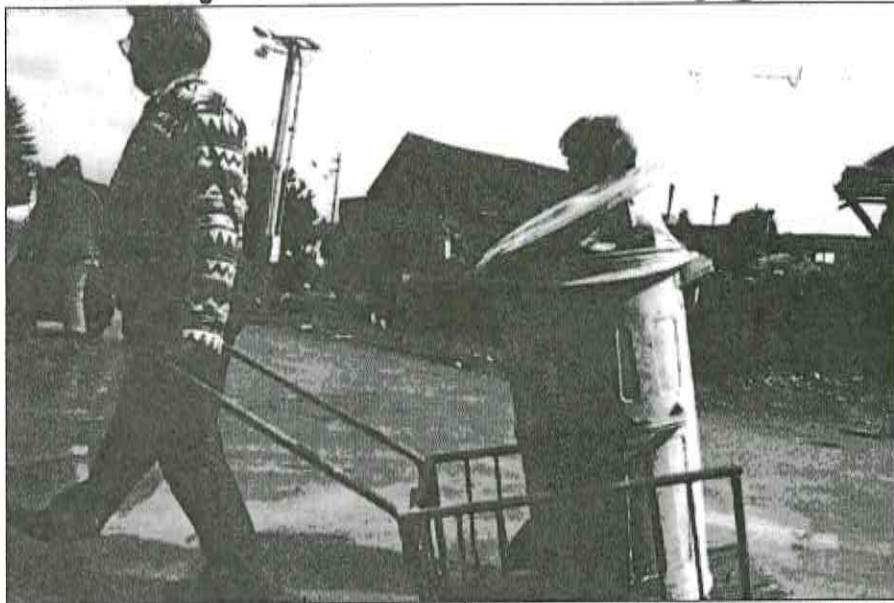
V Olomouci pokračuje likvidace škod i svépomocí.