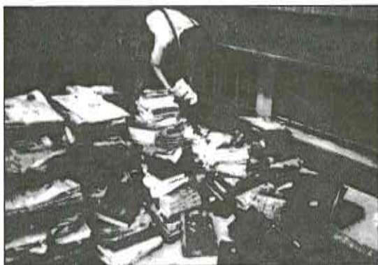
Tak dopadly sbírky zákonů uložené na Právnické fakultě Univerzity Palackého.

Zatím největší škody zjistili pracovníci Univerzity Palackého ve Sportovní hale, která byla zatopena do výše 1,5 metru (kotelna, trafostanice, celá plocha tělocvičny, laboratoře a všechny přilehlé prostory). Jen oprava nové palubové podlahy si vyžádá asi 3 až 4 miliony korun. Voda zaplavila také celé přízemí objektu FTK v Hynaisově ulici.